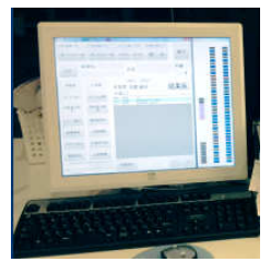
フロント受付コンピュータ