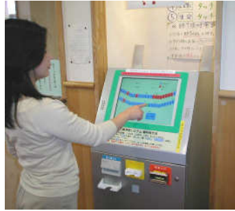
タッチパネル式打席予約入金システム