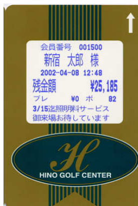
リライト型 ID カード