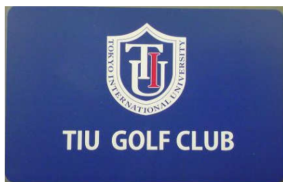
非接触 IC カード